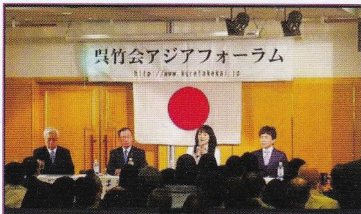
第 53 回呉竹会アジアフォーラム開催 (平成 30 年 4 月 28 日 アルカディア市ヶ谷) お陰様で大盛況! 参加者 600 名!