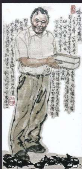
ウイグル ハムラティ