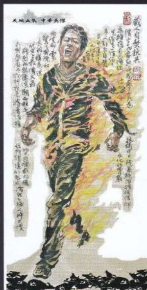
チベット人 焼身抗議